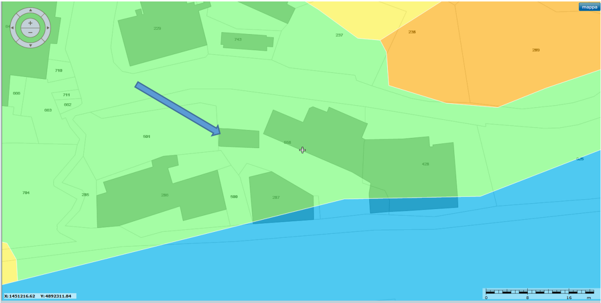
PDB SUSCETTIVITÀ DISSESTO NOLI - PG1