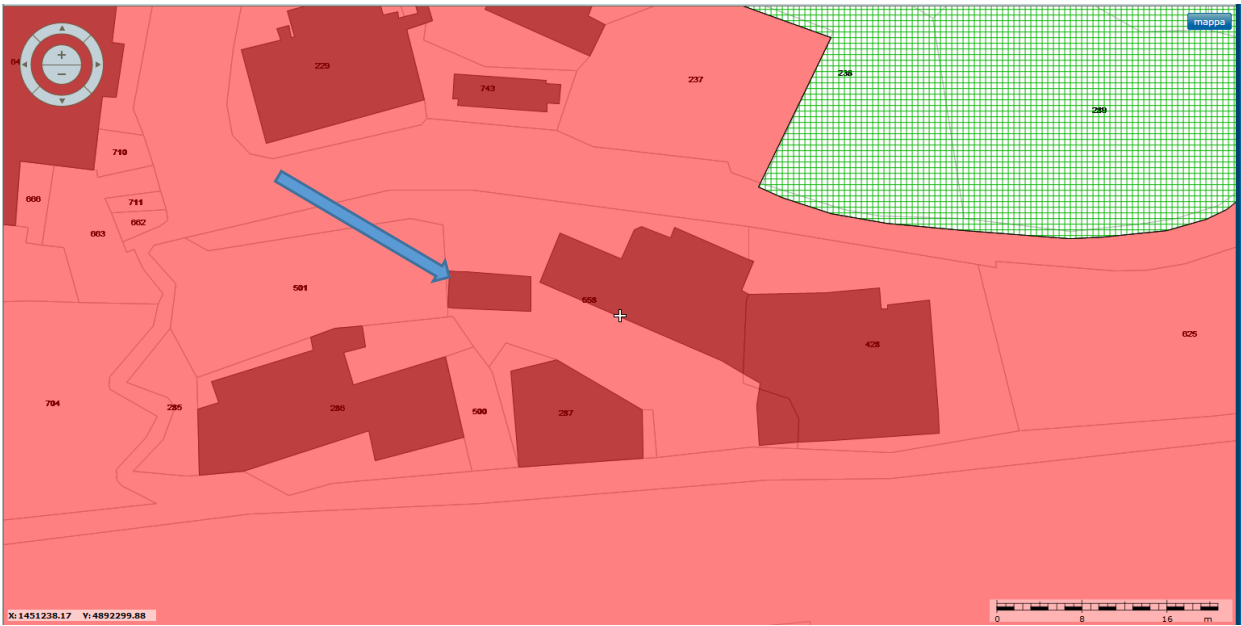
PUC - ACR4