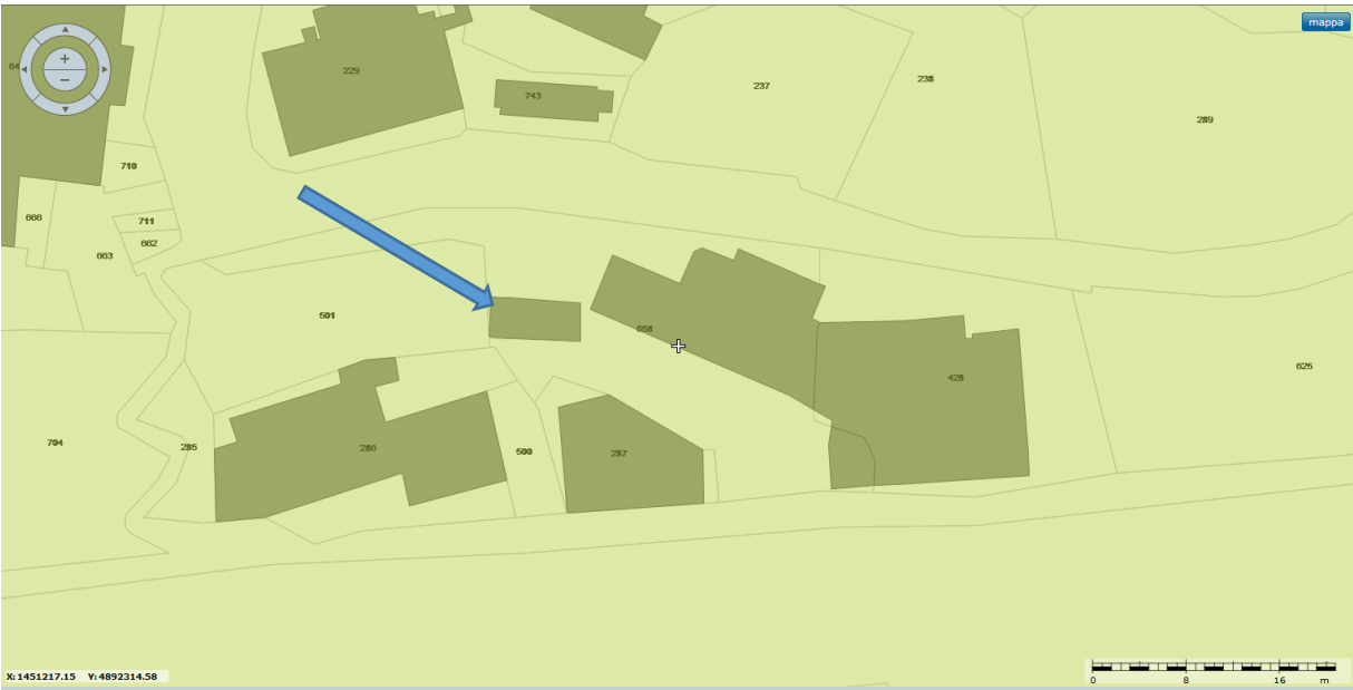
PDB VEGETAZIONALE COL - ISS - MA