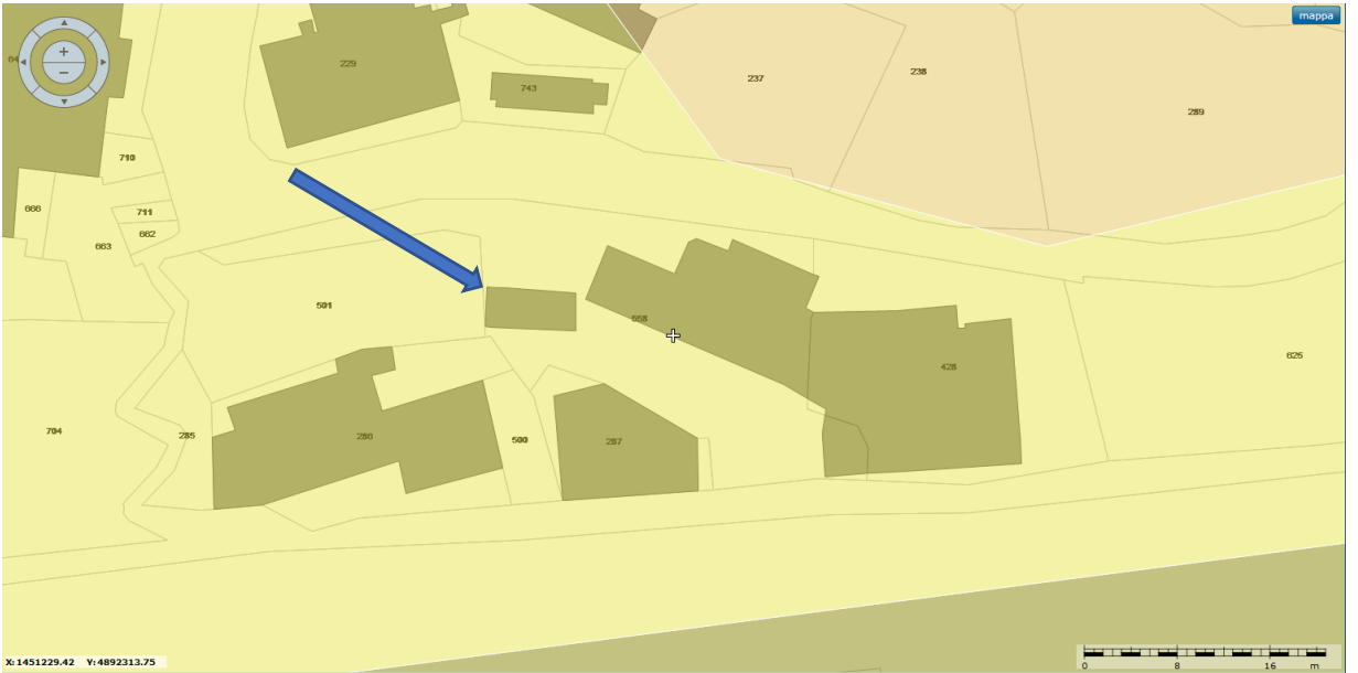
PDB INSEDIATIVO ID-CO