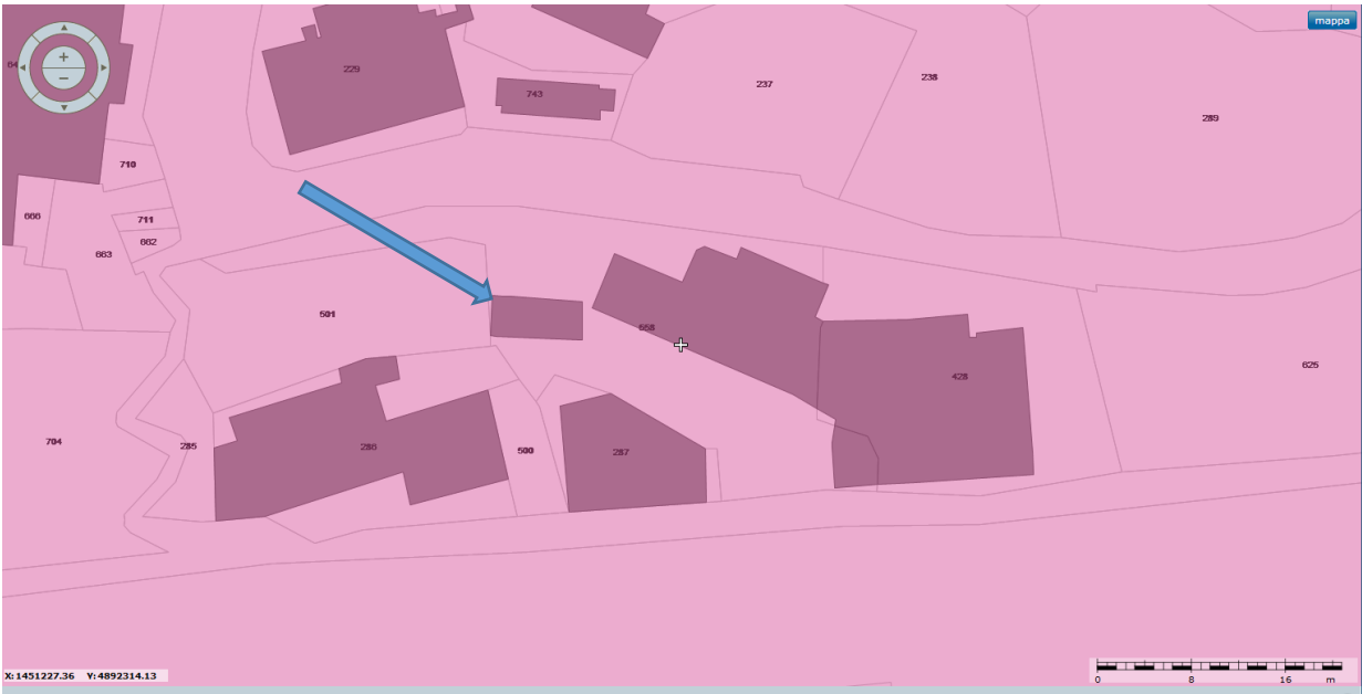
PDB GEOMORFOLOGICO MO-B