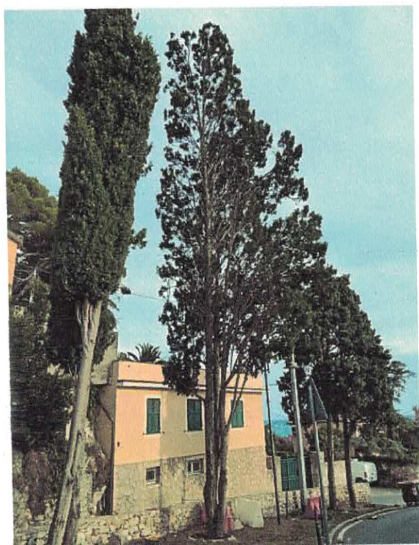
Albero n. 2249

Data ricontrollo: Priorità interventi: Alta